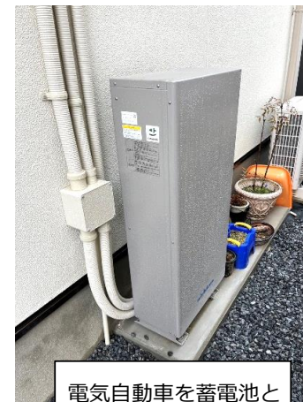
電気自動車を蓄電池として活用するためのV2Hスタンド