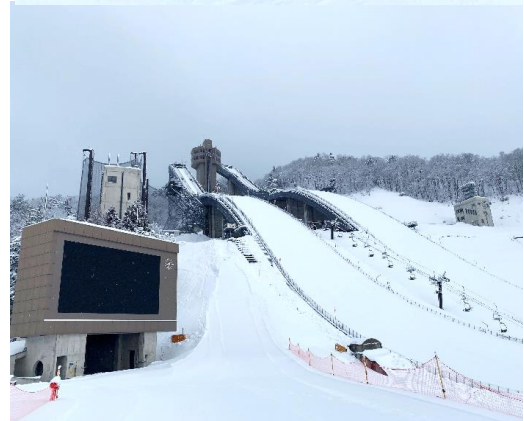
白馬ジャンプ競技場