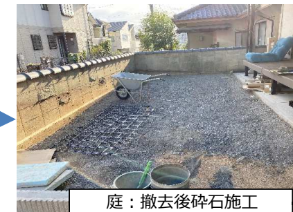
庭：撤去後碎石施工

子犬の庭は、庭木と築山を取り除き、碎石を敷き均し、その上に人工芝を施工しました。駐車場との間にはフェンスを設置し、ワンちゃんが自由に遊べるスペースとなり、濡れ縁をウッドデッキに替えて階段を設け、部屋からも直接出ることもできます。