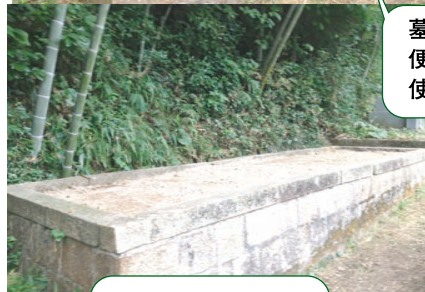
更地になりました

我が家の墓は自宅から少し離れた墓地の中にあり、左の写真のように背面は竹林となっています。しかも、車が置ける場所から、墓地内の狭い通路を100mほど下った場所にあり、数年前には父が足を滑らせて、2m下の墓に落ちた、なんて事もありました。 足の弱い母は10年前から、父も転倒事故以来墓参りができなくなり、その上、五つもある墓石の掃除なども大変なので「どこか一つにまとめて、移転せやいけんね」と話をしていました。姉の寺が管理している墓地で、車が近くまでいける所があり、移転する運びとなりました。 9月の彼岸前に、現在の墓を解体と「お骨」の取り出しに立ち会いましたら、先祖代々の墓から昔の小さな墓石が出てきて、そこには「小方村河野〇〇」と書かれていました。その文字のかすれた小さな墓石から、遠い先祖の生きた証を見つけると、苦労したろう先祖の一人一人に自然と手が合わさりました。(啓)