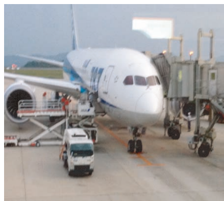
最新鋭機ボーイング787 (広島空港にて)