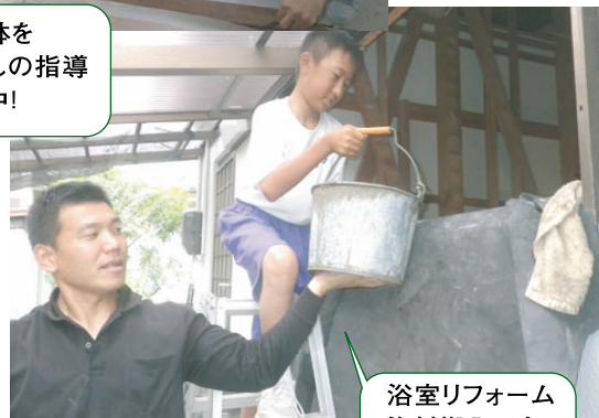
浴室リフォーム 資材搬入です。

表題の「キャリアスタートウィークって何?」と思われた方も多いのではないのでしょうか。 キャリアスタートウィークとは中学生の一週間の「職場体験」のことです。早いもので、本社の地元「小方中学校」の生徒さんを受け入れ始めてかれこれ7年になります。毎年、夏休みの終わりの週に月曜日から金曜日まで、会社の始業前のラジオ体操から体験してもらっています。