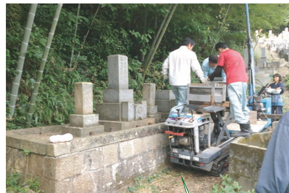
墓石を撤去 便利な機械を 使って手早い!

我が家の墓は自宅から少し離れた墓地の中にあり、左の写真のように背面は竹林となっています。しかも、車が置ける場所から、墓地内の狭い通路を100mほど下った場所にあり、数年前には父が足を滑らせて、2m下の墓に落ちた、なんて事もありました。 足の弱い母は10年前から、父も転倒事故以来墓参りができなくなり、その上、五つもある墓石の掃除なども大変なので「どこか一つにまとめて、移転せやいけんね」と話をしていました。姉の寺が管理している墓地で、車が近くまでいける所があり、移転する運びとなりました。 9月の彼岸前に、現在の墓を解体と「お骨」の取り出しに立ち会いましたら、先祖代々の墓から昔の小さな墓石が出てきて、そこには「小方村河野〇〇」と書かれていました。その文字のかすれた小さな墓石から、遠い先祖の生きた証を見つけると、苦労したろう先祖の一人一人に自然と手が合わさりました。(啓)