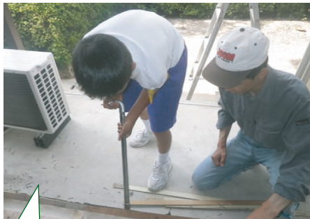
床の解体を 大工さんの指導 で体験中!

表題の「キャリアスタートウィークって何?」と思われた方も多いのではないのでしょうか。 キャリアスタートウィークとは中学生の一週間の「職場体験」のことです。早いもので、本社の地元「小方中学校」の生徒さんを受け入れ始めてかれこれ7年になります。毎年、夏休みの終わりの週に月曜日から金曜日まで、会社の始業前のラジオ体操から体験してもらっています。