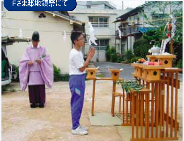
▲神妙に玉串を奉納するK君