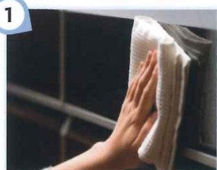
1 さっと水拭き、お手入れカンタン

高品位ホーローは、洗剤や調味料が付着しても変色・変質の心配がありません。油性の汚れも染み込まないのでキレイに拭き取れます。