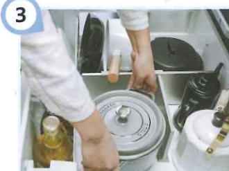
3 欠けにくく、衝撃にも耐える

表面がガラス質なので、染みやカビ、傷みや腐食に強く、ずっと長持ち。浴室の普段のお手入れはシャワーとスポンジで流すだけでずっとキレイが続きます。