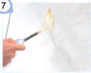
7 熱に強いので安心

インクジェット印刷技術で、多様な色・柄を表現することができます。いつまでも色あせないリアルな表現力で多様な空間コーディネートに役立ちます。