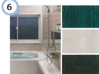
6 魅せる美しさ、見せる存在感

インクジェット印刷技術で、多様な色・柄を表現することができます。いつまでも色あせないリアルな表現力で多様な空間コーディネートに役立ちます。