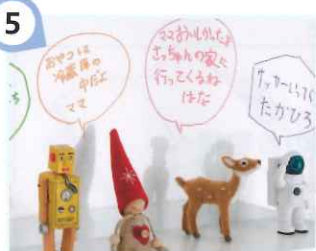
5 伝言板としても使える

ホーローはマグネットが付くから、小物を飾って自分好みのインテリアを楽しむことも。