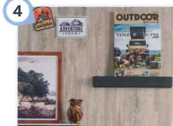
4 マグネットが付くので便利

欠けやすいイメージがあるホーローですが、タカラスタンダードの高品位ホーローは、鍋や硬いものをぶつけたり、モノを落としたりした際も安心です。