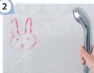
2 湿気に強く、カビを寄せ付けない

高品位ホーローは、洗剤や調味料が付着しても変色・変質の心配がありません。油性の汚れも染み込まないのでキレイに拭き取れます。