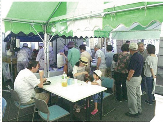
6月18日廿日市店手打ちそばに並ぶお客様

大竹店リニューアルイベント5月27日・28日そして廿日市店10周年イベント6月18日・19日と続けてイベントを行いました。本当にたくさんのお客様にお越しいただき有難うございました。紙面からですが、深く感謝申し上げます。廿日市店のイベントでは、大竹のイベントに続いて宮園そば打ち同好会の皆様にご協力いただき、地元では大変知られた同好会ですので、美味しいそばを食べに地元の皆様がたくさんお越しいただき、左の写真のように列ができるほどでした。何と、廿日市店は二日間で120組200名ものお客様が来られ、10年と言う年月の重みを改めて実感した次第です。これからも、皆様に喜ばれるイベントを行いますので、お気がるにお越しください。(啓)