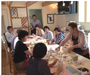
廿日市店2階は20人程の参加で熱気ムンムン!

廿日市店が宮内から現在の宮園1丁目に移転して早いもので7年。6月に移転しましたのでこの時期に周年のイベントを行っております。今年も網戸の張替に野菜の叩き売り、そして「ポーセラーツ」と言って真っ白なコップに様々な模様を貼り付け焼き上げると言う工芸の教室を行いました。