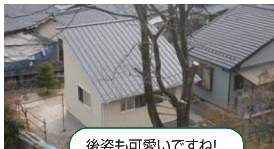
後姿も可愛いですね!