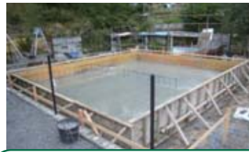
建物は小さくとも基礎はベタ基礎