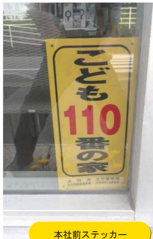
本社前ステッカー