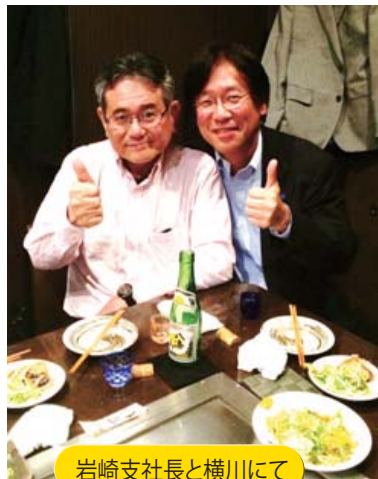
岩崎支社長と横川にて