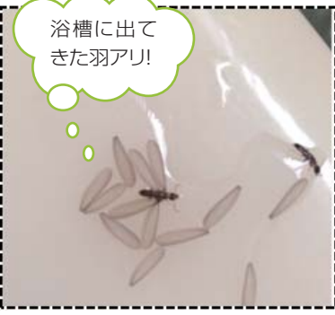
浴槽に出てきた羽アリ!